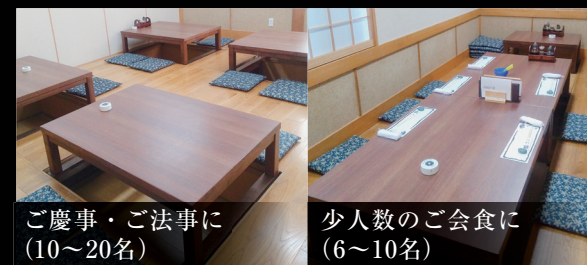
ご慶事・ご法事に (10~20名)